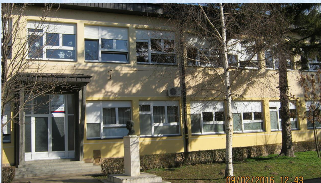
Главни улаз школе

Школа у Избишту основана је још 1779. године од када датира и први писмени помен о почетку рада школе, чему је значајно допринело доношење школског Устава 1776. године. У то време настава је извођена на немачком језику, а школу је похађало само неколико ђака из малог броја немачких породица које су тада живеле у селу. Двадесетак година касније почињу да се помињу и имена првих српских учитеља, о чему нема много писаних трагова.