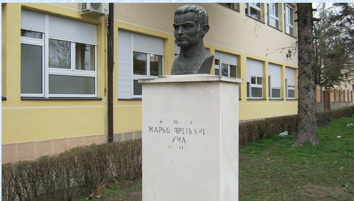
Биста народног хероја Жарка Зрењанина на улазу у школу

Може се слободно рећи да јој та улога припада и данас. Школа данас спада међу најбоље уређене сеоске основне школе општине Вршац, тако да јој могу позавидети и многе градске школе. Има кабинетску наставу, рачунаре за наставнике и ученике, интернет, сређену зборницу и библиотеку, модерну фискултурну салу, квалитетно решење грејања целог школског простора, школски разглас и савремен видео-надзор.